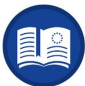
KOMPOONENT 1 Pamięć Europejska