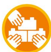
KOMPOONENT 2 2.2 Sieci Miast