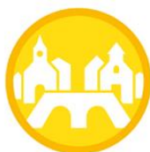
KOMPOONENT 2 2.1 Partnerstwo Miast