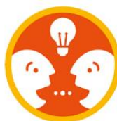
KOMPOONENT 2 2.3 Projekty Społeczeństwa Obywatelskiego