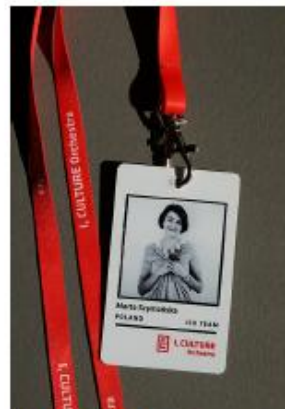
Przykład: Identyfikator na smyczy

Ilość: 150 szt. Każdy egzemplarz personalizowany (inne zdjęcie, inne dane, w podobnym układzie)